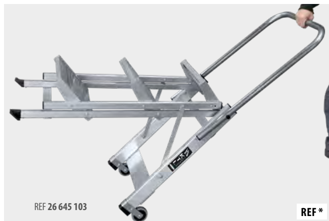
Barandilla de seguridad y ruedas de desplazamiento de Ø80 mm, según modelo Safety handrail and Ø80 mm scroll wheels, depending on model Main courante de sécurité et roues de déplacement de Ø80 mm pour, selon le modèle Corrimão de segurança e rodas de rolagem de Ø80 mm, consoante o modelo