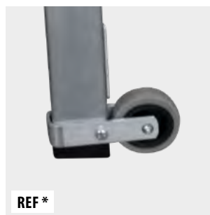
Rueda de desplazamiento de Ø80 mm Scroll wheel of Ø80 mm Roue de déplacement de Ø80 mm Roda de rolagem de Ø80 mm

Concebido para suportar 150 kg de acordo com a norma EN 14183.