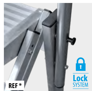
Sistema de bloqueo de seguridad en barandilla Safety locking system on safety railing Système de verrouillage en rampe de sécurité Sistema de bloqueio em corrimão de segurança