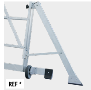
Estabilizador lateral Side stabiliser Stabilisateur latéral Estabilizador lateral