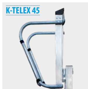
Guardacuerpos fijo Fixed bodyguard Garde-corps fixe Guarda-costas fixo