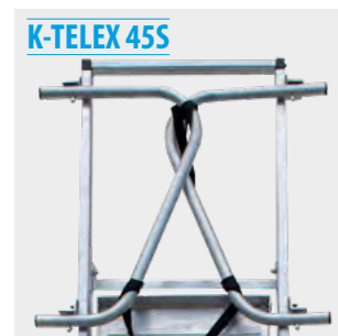
Guardacuerpos abatible Hinged bodyguard Garde-corps à charnière Guarda-costas articulado

Productos suministrados parcialmente desmontados. Products supplied partially disassembled. Produits fournis partiellement démontés. Produtos fornecidos parcialmente desmontados.