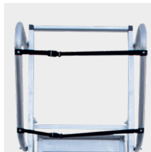
Doble cierre de seguridad Double safety lock Double verrouillage de sécurité Bloqueio duplo de segurança

Concebida para suportar 150 kg de acordo com a norma EN 131-7.