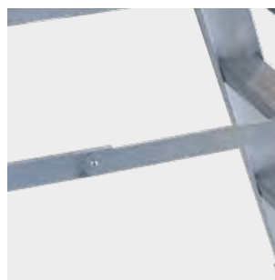
Tirante de seguridad de aluminio Aluminium safety brace Support de sécurité en aluminium Braçadeira de segurança em alumínio