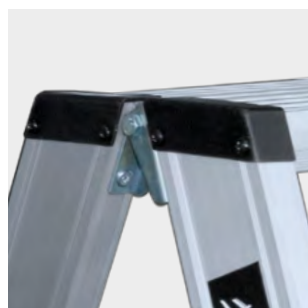
Bisagras en acero cincado de 3 mm de espesor Hinges in 3 mm thickness galvanized steel Charnières en acier zingué de 3 mm d'épaisseur Dobradiças em aço galvanizado de 3 mm de espessura

Concebida para suportar 150 kg de acordo com a norma EN 131.