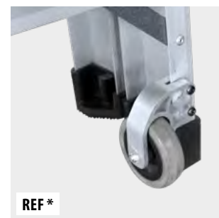
Ruedas de desplazamiento de Ø80 mm Scroll wheel of Ø80 mm Roue de déplacement de Ø80 mm Roda de rolagem de Ø80 mm