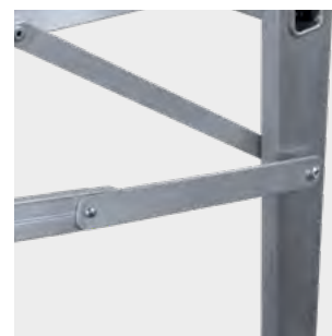
Tirante de seguridad en aluminio Safety straps in aluminum Traverses de sécurité en aluminium Cintas de segurança de alumínio