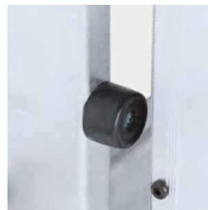
Topo antiatrapamiento Anti-trapping stop Arrêt anti-piégeage Batente anti-encarceramento