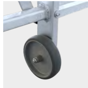
Rueda de desplazamiento de Ø125 mm Scroll wheel of Ø125 mm Roue de déplacement de Ø125 mm Roda de rolagem de Ø125 mm

Productos suministrados parcialmente desmontados. Products supplied partially disassembled. Produits fournis partiellement démontés. Produtos fornecidos parcialmente desmontados.