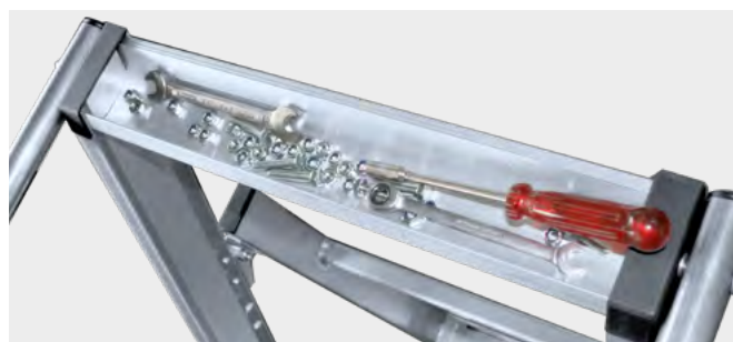
Bandeja para herramientas Tray for tools Plateau pour les outils Bandeja para ferramentas