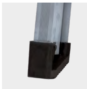
Tapafinal de SBS con relieves antideslizantes SBS end cap with anti-slip reliefs Patin en SBS avec reliefs antidérapants Pé de SBS com relevos antiderrapantes