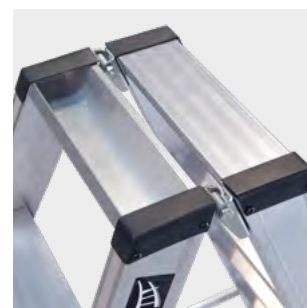
Bandeja para herramientas Tray for tools Plateau pour les outils Bandeja para ferramentas