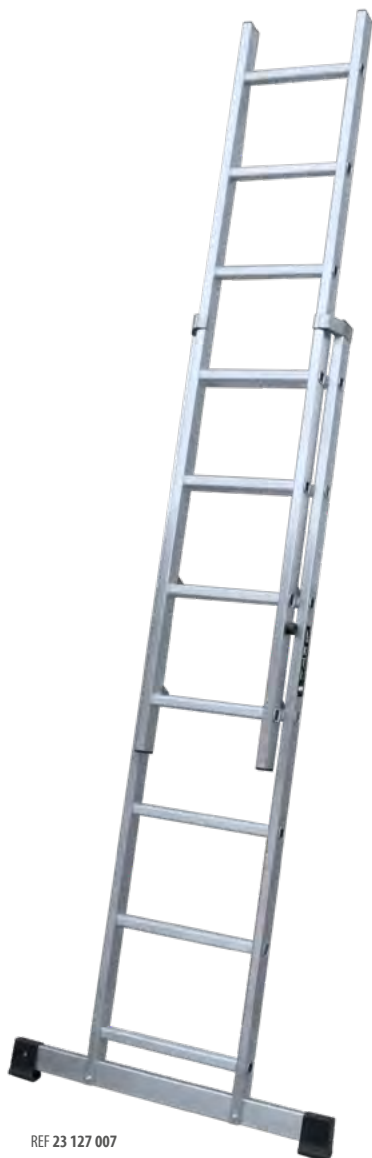
REF 23 127 007