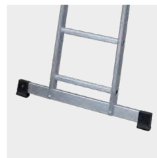
Base estabilizadora Stabiliser base Base stabilisatrice Base estabilizadora