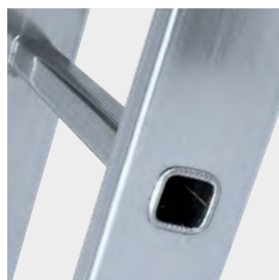
Peldaños engastados con relieves antideslizantes Rungs set with anti-slip reliefs Échelons serties avec des reliefs antidérapants Degraus inseridos com relevos antiderrapantes