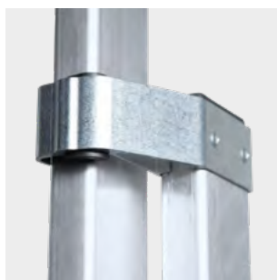
Sistema de deslizamiento de aluminio Aluminum sliding system Système de glissement en aluminium Sistema deslizante de alumínio

Productos suministrados parcialmente desmontados. Products supplied partially disassembled. Produits fournis partiellement démontés. Produtos fornecidos parcialmente desmontados.