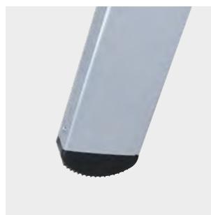
Tapafinal de SBS con relieves antideslizantes SBS end cap with anti-slip reliefs Patin en SBS avec reliefs antidérapants Pé de SBS com relevos antiderrapantes