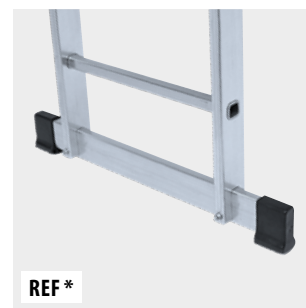
Base estabilizadora Stabiliser bar Barre stabilisatrice Base estabilizadora