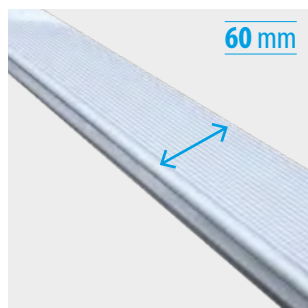
Peldaño ancho de 60 mm con relieves antideslizantes Wide rung of 60 mm with anti-slip reliefs Échelon large de 60 mm avec des reliefs antidérapants Degrau grande de 60 mm com relevos antiderrapantes