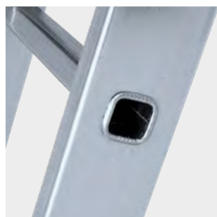
Peldaños engastados con relieves antideslizantes Rungs set with anti-slip reliefs Échelons serties avec des reliefs antidérapants Degraus inseridos com relevos antiderrapantes

✂ Productos suministrados parcialmente desmontados. Products supplied partially disassembled. Produits fournis partiellement démontés. Produtos fornecidos parcialmente desmontados.