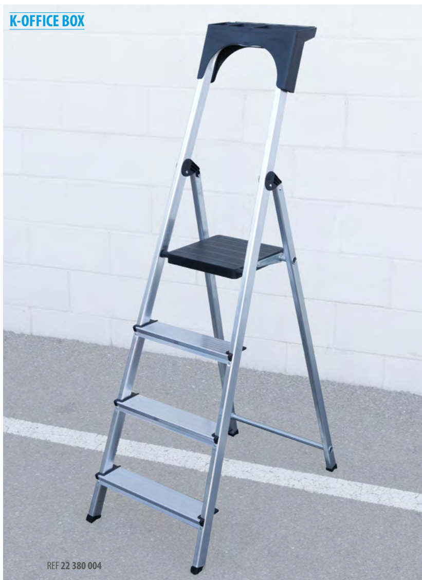
REF 22 380 004