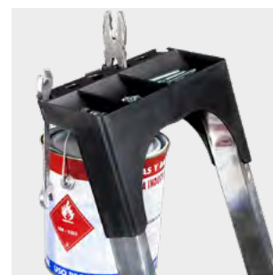
Bandeja para herramientas Tray for tools Porte-outils Bandeja de ferramentas