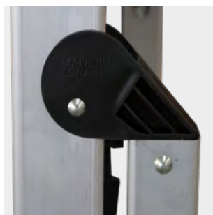
Bisagras de PP PP hinges Charnières en PP Dobradiça PP