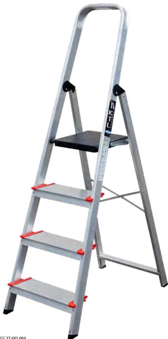
REF 27 681 004

ES Plataforma de PP de 25x25 cm con sistema de bloqueo exclusivo. Escalones anchos con relieves antideslizantes. Perfecta para trabajos profesionales ocasionales. Diseñada para soportar 150 kg según norma EN 131.